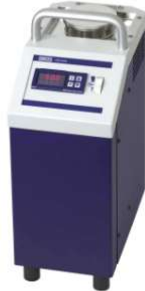
Bain d'étalonnage portable CTB9100

Deux gammes : -35°C à +165°C ou 40°C à 225°C Cuve de Ø 60mm, profondeur d'immersion de 150 mm Temps de réponse rapide Vitesse d'agitation ajustable