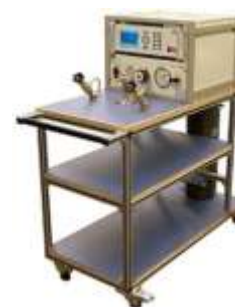
Banc d'étalonnage mobile

Nos ensembles répondent à votre cahier des charges et à vos contraintes techniques et financières.